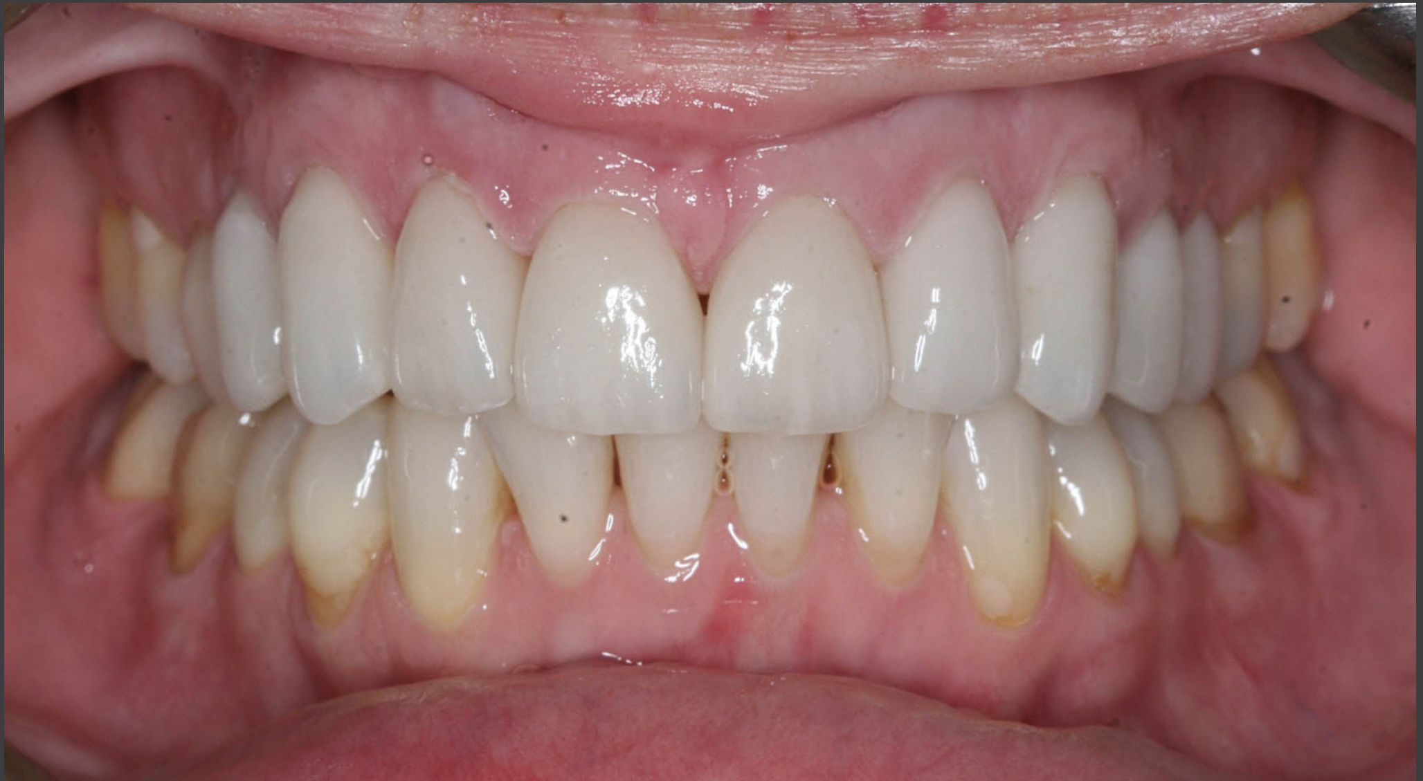
Cas réalisé par Dr Christian Lafrenière